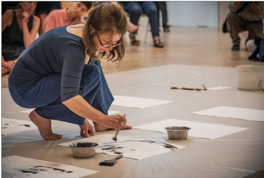
Performances - Bourges Abbey Barthelemy-Danis